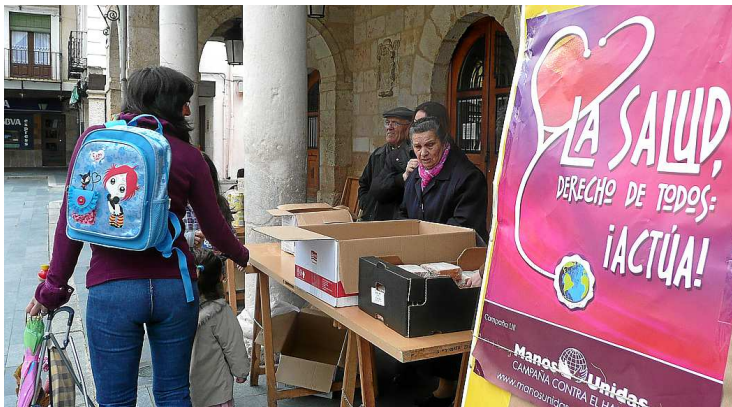
Los burgenses mostrando su solidaridad en la plaza Mayor.